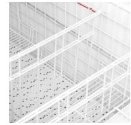
Justerbar falsk bund