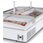
Ø-installation (hylde er tilkøb)