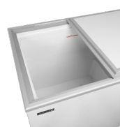
Flade skydelåg - skummet