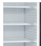
Vertikalt, indvendig lys