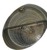
Indvendig ventilator og kurv