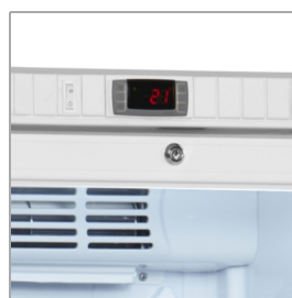
Termostat med tydelig ekstern alarm