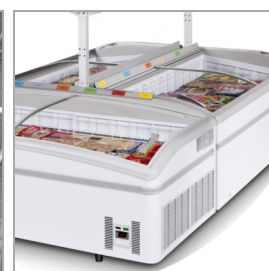
Ø-installation (hylde er tilkøb)