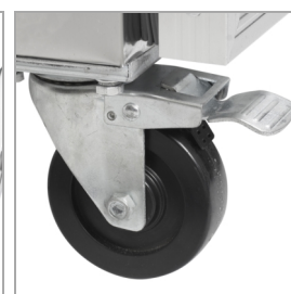
Solide hjul som valgmulighed