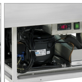
Automatisk fordampning af afrimningsvand