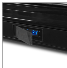
Beskyttende afskærmning af termostat