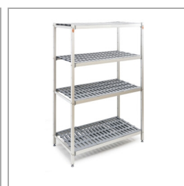
Hylde som tilbehør