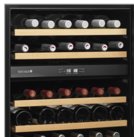
Træhylder til udtræk