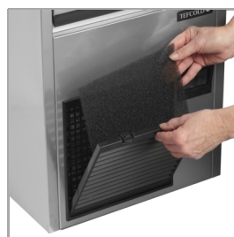
Kondensatorfilter er nemt at rengøre