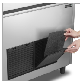
Kondensatorfilter er nemt at rengøre