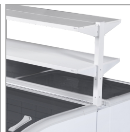
Præsentationshylder er tilbehør