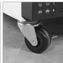
Solide hjul som valgmulighed