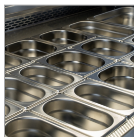
Designet til GN1/1 kantiner, ikke inkluderet