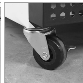
Solide hjul som valgmulighed